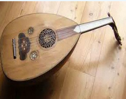
مدينة الفن والطرب والموسيقى